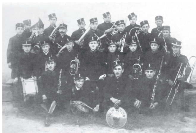
Svätójurská dychovka, 1925