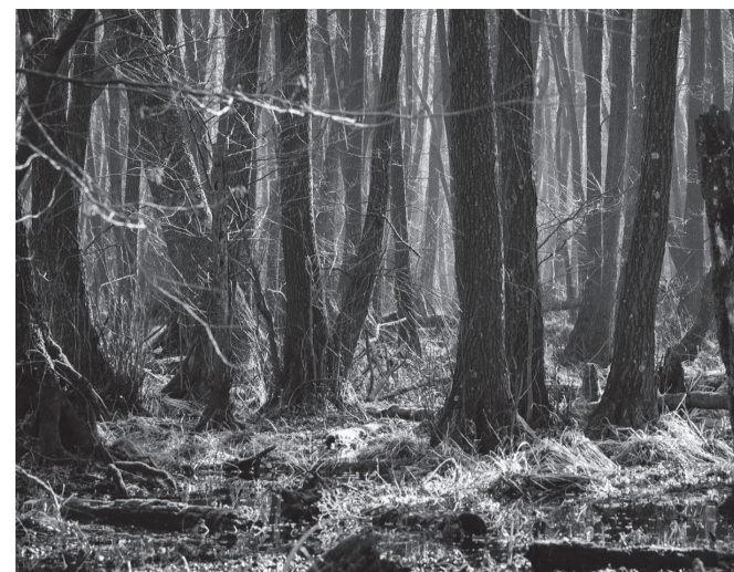
Ilustr. foto: Šúrsky les