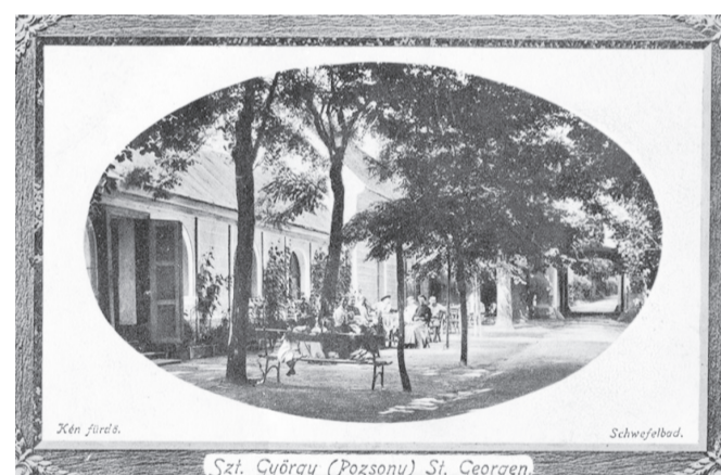
Pohľadnica odoslaná v roku 1911, - Svätý Jur na starých pohľadniach