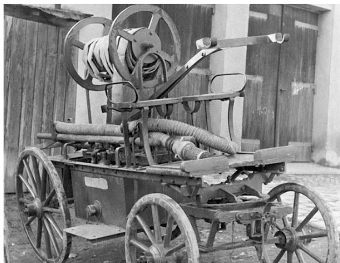
Ručná hasičská striekačka z roku 1882

Už v roku 1618 sa v zápisnici z mestského zastupiteľstva vo Svätom Jure píše, že občianstvo si každý rok v apríli volilo štyroch dozorcov, ktorí každý večer kontrolovali uhasenie ohnísk v domoch. V Uhorsku sa však dobrovoľné hasičské zbory začali zakladat až po roku 1788, kedy cisár Jozef II. vydal prvý požiarň poriadok. V roku 1888 vstúpilo do platnosti nariadenie, podľa ktorého mali byť v každej obci s viac ako 50 usadlosťami zriadené hasičské zbrojnice. Predstavitelia obce každý rok vypracovali zoznam 20-40-ročných mužov, ktorým vznikla povinnosť konať požiarňu službu. Najstarší dobrovoľný hasičský zbor na Slovensku vznikol v r. 1847 v Prešove. Dobrovoľný hasičský zbor v Bratislave bol založený v roku 1867 a vznik Spolku dobrovoľných hasičov vo Svätom Jure sa datuje do roku 1881. V roku 1914 bolo na Slovensku 263 dobrovoľných hasičských zborov a v roku 1933 ich Zemska hasičská jednota evidovala až 2981. Významný podiel na zakladaní a organizovaní dobrovoľných hasičských spolkov v mestách a obciach mali predstavitelia miestnej inteligencie - učitelia, farári, lekári, či notári. Nebolo tomu inak ani vo Svätom Jure.