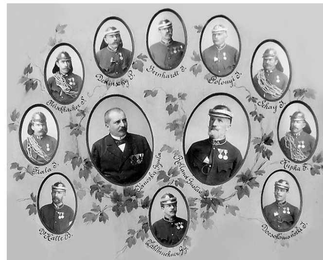
Historické tablo DHZ Svätý Jur (vyrez), 1899