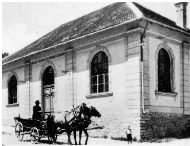
Turna, cca. 1945, - Svätý Jur na starých pohľadniciach

• Valné zhromaždenie 3. júna 1945. Z trosiek starého zboru vznikol zbor nový, ktorý s novým elánom a s novou chuťou zapojil sa do budovateľskej práce. Pripravný výbor a dočasní funkcionári skončili svoju prácu a odovzdávajú vedenie súčasťším rukám, ktoré si na týchto voľbách zvolíte. • Čo sa týka finančnej stránky zboru oznamujeme, že zbor nemal v hotovosti žiadne peniaze a začal bez groša.